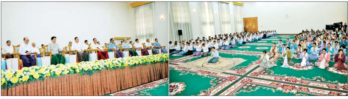
နိုင်ငံတော်လုံခြုံရေးနှင့် အေးချမ်းသာယာရေးကော်မရှင် ဒုတိယဥက္ကဋ္ဌ ဒုတိယတပ်မတော်ကာကွယ်ရေးဦးစီးချုပ် ဒုတိယဗိုလ်ချုပ်မှူးကြီး စိုးဝင်းနှင့်ဇနီး ဒေါ်သန်းသန်းနွယ် ဦးဆောင်သည့် တပ်မတော်(ကြည်း၊ ရေ၊ လေ) မိသားစုများက (၈၁)နှစ်မြောက် တပ်မတော်နေ့အခမ်းအနားသို့ တက်ရောက်ကြမည့် အငြိမ်းစားတပ်မတော်အရာရှိကြီးများအား ဂါရဝပြုကန်တော့စဉ်။

အဆိုပါဂါရဝပြုကန်တော့သည့် အခမ်းအနားသို့ အငြိမ်းစား တပ်မတော် အရာရှိကြီး ၁၈ ဦးနှင့် ဇနီး ကိုးဦး စုစုပေါင်း ၂၇ ဦးတို့ ကန်တော့ခံ တက်ရောက်ကြပြီး နိုင်ငံတော်လုံခြုံရေးနှင့် အေးချမ်းသာယာရေးကော်မရှင် ဥက္ကဋ္ဌ တပ်မတော်ကာကွယ်ရေးဦးစီးချုပ် ဗိုလ်ချုပ်မှူးကြီး မင်းအောင်လှိုင် ကိုယ်စား နိုင်ငံတော်လုံခြုံရေးနှင့် အေးချမ်းသာယာရေး ကော်မရှင် ဒုတိယဥက္ကဋ္ဌ ဒုတိယ တပ်မတော်ကာကွယ်ရေးဦးစီးချုပ် စာမျက်နှာ ၅ ကော်လံ ၁ သို့