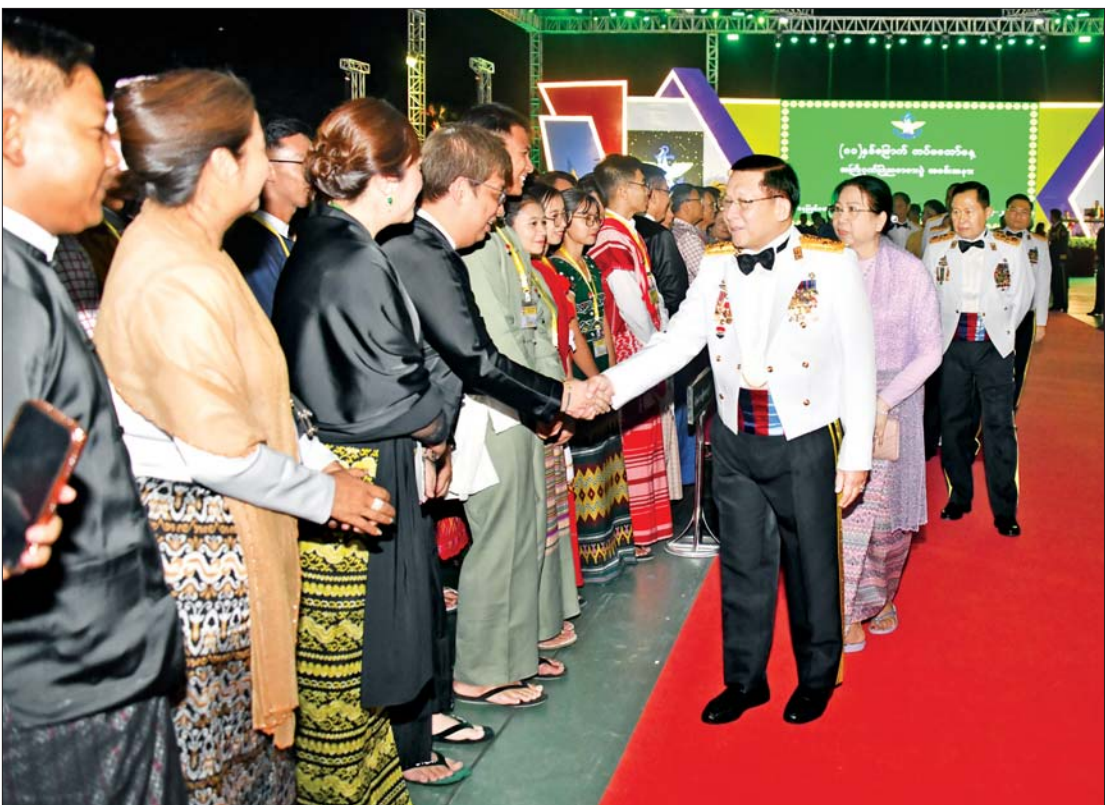
နိုင်ငံတော်လုံခြုံရေးနှင့် အေးချမ်းသာယာရေးကော်မရှင်ဥက္ကဋ္ဌ တပ်မတော်ကာကွယ်ရေးဦးစီးချုပ် ဗိုလ်ချုပ်မှူးကြီး မင်းအောင်လှိုင်နှင့် ဇနီး ဒေါ်ကြူကြူလှ (၈၁)နှစ်မြောက် တပ်မတော်နေ့ ဂုဏ်ပြုညစာစားပွဲ အခမ်းအနားသို့ တက်ရောက်လာကြသူများအား ရင်းရင်းနှီးနှီး နှုတ်ဆက်စဉ်။

ထို့နောက် နိုင်ငံတော်လုံခြုံရေးနှင့် အေးချမ်းသာယာရေးကော်မရှင်ဥက္ကဋ္ဌ တပ်မတော်ကာကွယ်ရေး ဦးစီးချုပ် ဗိုလ်ချုပ်မှူးကြီး မင်းအောင်လှိုင်နှင့် ဇနီး ဒေါ်ကြူကြူလှတို့သည် (၈၁)နှစ်မြောက် တပ်မတော်နေ့အထိမ်းအမှတ် ဂုဏ်ပြု ညစာစားပွဲသို့ တက်ရောက်လာကြသည့် ကော်မရှင်ဒုတိယဥက္ကဋ္ဌ ဒုတိယ တပ်မတော်ကာကွယ်ရေးဦးစီးချုပ် ဒုတိယ ဗိုလ်ချုပ်မှူးကြီး စိုးဝင်း၊ ကော်မရှင် အတွင်းရေးမှူး ကာကွယ်ရေးဦးစီးချုပ် (ကြည်း) ဗိုလ်ချုပ်ကြီး ရဲဝင်းဦးနှင့် ဇနီး၊ စာမျက်နှာ ၃ ကော်လံ ၁ သို့