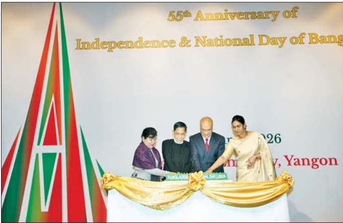
ဝန်ကြီးချုပ် ဦးစိုးသိန်းနှင့် ဇနီး၊ နိုင်ငံခြားရေးဝန်ကြီး ဌာန ဒုတိယဝန်ကြီးနှင့် ဇနီး၊ ရန်ကုန်မြို့တော်စည်ပင် သာယာရေးကော်မတီဥက္ကဋ္ဌ မြို့တော်ဝန်နှင့် ဇနီး၊ နိုင်ငံခြားရေးဝန်ကြီးဌာနမှ တာဝန်ရှိသူများနှင့် ရန်ကုန်မြို့အခြေစိုက် နိုင်ငံခြားသံရုံးများမှ သံအမတ်ကြီးများ၊ သံရုံးယာယီတာဝန်ခံများ၊ စစ်သံမှူးများ၊ ကုလသမဂ္ဂဆိုင်ရာ ဌာနကော်မတီဝင် လှယ်များနှင့် ဖိတ်ကြားထားသည့် ဧည့်သည်တော် များ တက်ရောက်ကြကြောင်း သိရသည်။ သတင်းစဉ်

နိုင်ငံတော်သီချင်းနှင့် ဘင်္ဂလားဒေ့ရှ်နိုင်ငံ နိုင်ငံတော် သီချင်းတို့ဖြင့် အခမ်းအနားကို ဖွင့်လှစ်ကြပြီး မြန်မာ နိုင်ငံဆိုင်ရာ ဘင်္ဂလားဒေ့ရှ်နိုင်ငံသံအမတ်ကြီး H.E. Dr. Md. Monwar Hossain က နှုတ်ခွန်းဆက်စကား ပြောကြားသည်။ ယင်းနောက် ပြည်ထောင်စုဝန်ကြီးနှင့် ဇနီး၊ သံအမတ်ကြီးနှင့် ဇနီးတို့သည် ဘင်္ဂလားဒေ့ရှ်နိုင်ငံ၏ (၅၅)နှစ်မြောက် လွတ်လပ်ရေးနေ့နှင့် အမျိုးသားနေ့ အထိမ်းအမှတ် ကိတ်မုန့်လှီးကြပြီး အခမ်းအနား သို့ တက်ရောက်လာကြသူများနှင့်အတူ စုပေါင်း မှတ်တမ်းတင်ဓာတ်ပုံရိုက်ကာ အခမ်းအနားသို့ တက်ရောက်လာသော ဧည့်သည်တော်များအား သံအမတ်ကြီးနှင့် ဇနီးတို့က ညစာစားပွဲဖြင့် တည်ခင်း ဧည့်ခံသည်။ အဆိုပါအခမ်းအနားသို့ ရန်ကုန်တိုင်းဒေသကြီး