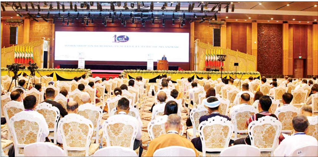
ပြည်တွင်း လက်နက်ကိုင်ပဋိပက္ခများချုပ်ငြိမ်းပြီး ထာဝရငြိမ်းချမ်းရေးရရှိရေးအတွက် ၂၀၂၅ ခုနှစ် အောက်တိုဘာ ၁၆ ရက်က တစ်နိုင်လုံး ဝစ်ခတ်တိုက်ခိုက်မှုရပ်စဲရေး သဘောတူစာချုပ်(NCA) (၁၀)နှစ်ပြည့် နှစ်ပတ်လည်နေ့အခမ်းအနားတွင် ငြိမ်းချမ်းသောမြန်မာ့အနာဂတ်တည်ဆောက်ခြင်း အလုပ်ရုံဆွေးနွေးပွဲကျင်းပစဉ်။

ကြုံတွေ့ခံစားနေရ အကြမ်းဖက်သောင်းကျန်းသူများက စစ်ရေးနှင့်မသက်ဆိုင်သော မြို့ရွာများကို တိုက်ခိုက်ဖျက်ဆီးပြီး လူသားတိုင်းပြင် စစ်ရာဇဝတ်မှုများ ကျူးလွန်လျက်ရှိသော် လည်း ပြည်ပမှဝိဒိယာနှင့် ၎င်းတို့၏ အပေါင်းပါများက တပ်မတော်ကို အပြစ်ရှာ စွပ်စွဲလုပ်ကြံ ဖန်တီးလျက်ရှိသည်။ သောင်းကျန်းသူများက တော်လှန်ရေးဟု ဆိုသော်လည်း အပျက်လုပ်ရပ်များကိုသာ လုပ်ကိုင်နေကြသည်ကို တွေ့ရမည်ဖြစ်