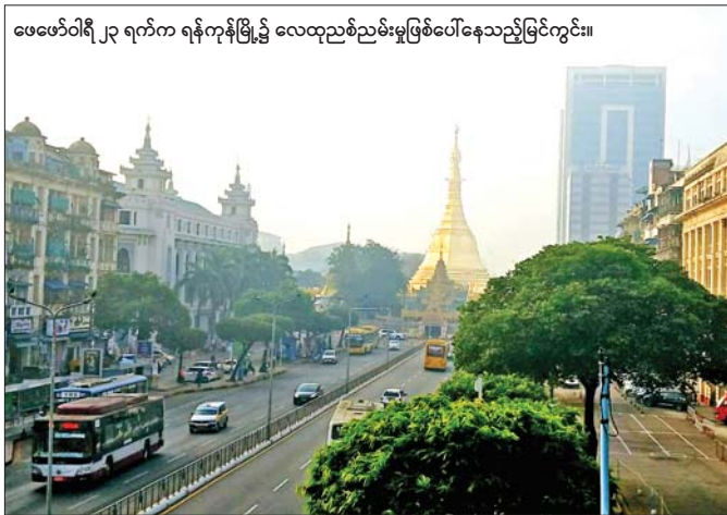
ဖေဖော်ဝါရီ ၂၃ ရက်က ရန်ကုန်မြို့၌ လေထုညစ်ညမ်းမှုဖြစ်ပေါ်နေသည့်မြင်ကွင်း။

လေထုညစ်ညမ်းမှုဖြစ်စေတဲ့ အမှုန်အများစုဟာ လေထုပမာဏ သေးငယ်လေလေ လူ့ခန္ဓာကိုယ် အတွင်းဝင်ရောက်ဖို့ လွယ်ကူလေလေဖြစ်ပါတယ်။ ၁၀ မိုက်ခရိုမီတာထက်သေးငယ်တဲ့ အမှုန်အများ