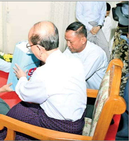
နိုင်ငံတော်လုံခြုံရေးနှင့် အေးချမ်းသာယာရေးကော်မရှင် ဒုတိယဥက္ကဋ္ဌ ဒုတိယတပ်မတော် ကာကွယ်ရေးဦးစီးချုပ် ဒုတိယဗိုလ်ချုပ်မှူးကြီး စိုးဝင်းက ဗိုလ်ချုပ်ကြီး သိန်းစိန် (အငြိမ်းစား) အား ဂါရဝပြုလက်ဆောင်ပစ္စည်းများ ဂါရဝပြုပေးအပ်စဉ်။

အဆက်ဆက် လွတ်လပ်ရေးမတိုင်မီ၊ လွတ်လပ်ရေးရပြီးနှင့် လက်ရှိကာလအထိ အဆင့်ဆင့်သော တပ်မတော်ခေါင်းဆောင်ကြီးများ၊ အဓိအဖ၊ ဆရာသမားများ၏ သွန်သင်ဆုံးမမှုများ၊ သင်ဆရာ၊ မြင်ဆရာ၊ ကြားဆရာများ၏ အဆင့်ဆင့်လက်ဆင့်ကမ်း သွန်သင် ဆုံးမမှုများကြောင့် ရပ်တည်နိုင်ခဲ့ခြင်း ဖြစ်ကြောင်း၊ ဆက်လက်၍လည်း မိမိတို့၏ တပ်မတော်ကို တပ်မတော်၏ အဓိအဖများအားလုံးနှင့် သင်ဆရာ၊ မြင်ဆရာ၊ ကြားဆရာ အားလုံးတို့က ကောင်းမွန်သော လမ်းညွှန်ဆုံးမမှုများ ပြုပေးနိုင်ပါရန် တပ်မတော်သားများနှင့် မိသားစု