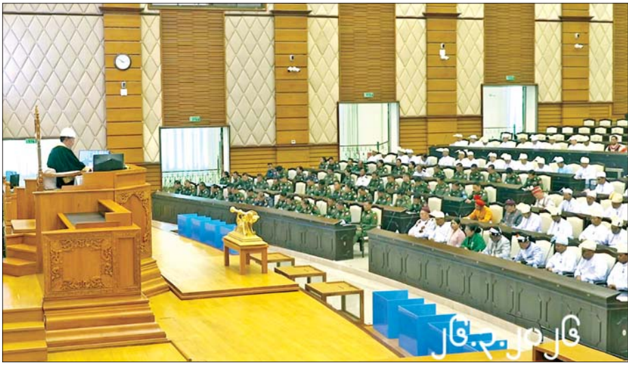
တတိယအကြိမ် အမျိုးသားလွှတ်တော် ပထမပုံမှန်အစည်းအဝေး တတိယနေ့ ကျင်းပစဉ်။

နေပြည်တော် မတ် ၂၆ တတိယအကြိမ် အမျိုးသား လွှတ်တော် ပထမပုံမှန်အစည်း အဝေး တတိယနေ့ကို ယနေ့နံနက် ၁၀ နာရီတွင် နေပြည်တော်ရှိ လွှတ်တော် အဆောက်အအုံ အမျိုးသားလွှတ်တော် အစည်း အဝေးခန်းမ၌ ကျင်းပသည်။ အစည်းအဝေးတွင် အမျိုးသား လွှတ်တော်ဥက္ကဋ္ဌဦးအောင်လင်းဇွေး က တတိယအကြိမ် အမျိုးသား လွှတ်တော် ပထမပုံမှန်အစည်း အဝေးတတိယနေ့သို့ တက်ရောက် ခွင့်ရှိသည့် အမျိုးသားလွှတ်တော် ကိုယ်စားလှယ်ဦးရေ စုစုပေါင်း ၂၁၃ ဦးစလုံး တက်ရောက်သည့် အတွက် ရာခိုင်နှုန်းပြည့်ဖြစ်သဖြင့် အစည်းအဝေး အထမြောက် ကြောင်းနှင့် စတင်ကျင်းပကြောင်း ကြေညာကာ အစည်းအဝေး တက်ရောက်မှု အခြေအနေကို လွှတ်တော်၏ အတည်ပြုချက် ရယူ၍ မှတ်တမ်းတင်သည်။