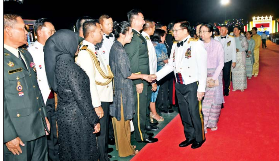
နိုင်ငံတော်လုံခြုံရေးနှင့် အေးချမ်းသာယာရေးကော်မရှင်ဥက္ကဋ္ဌ တပ်မတော်ကာကွယ်ရေးဦးစီးချုပ် ဗိုလ်ချုပ်မှူးကြီး မင်းအောင်လှိုင်နှင့် ဇနီး ဒေါ်ကြာကြာလှ (၈၁)နှစ်မြောက် တပ်မတော်နေ့ ဂုဏ်ပြုညစာစားပွဲ အခမ်းအနားသို့ တက်ရောက်လာကြသူများအား ရင်းရင်းနှီးနှီးနှုတ်ဆက်စဉ်။

မှ တပ်ဖွဲ့ဝင်များ၊ တိုင်းရင်းသားဖွံ့ဖြိုးရေးတက္ကသိုလ်မှ ဆရာဆရာမများနှင့် ကျောင်းသားကျောင်းသူများ၊ အထူးဖိတ်ကြားထားသည့်စည်ညီညွတ်တော်များအား ရင်းရင်းနှီးနှီး နှုတ်ဆက်သည်။ ယင်းနောက်နိုင်ငံတော်လုံခြုံရေးနှင့် အေးချမ်းသာယာရေးကော်မရှင်ဥက္ကဋ္ဌ တပ်မတော်ကာကွယ်ရေး