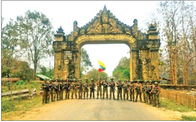
အကြမ်းဖက်သောင်းကျန်းသူများ ယာယီစိုးမိုးထားသည့် တကောင်းမြို့အား ၁၃-၂၀၂၆ ရက်နေ့တွင် တပ်မတော်စစ်ကြောင်းများက ပြန်လည်သိမ်းပိုက်ရရှိစဉ်။