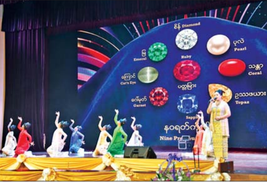
နိုင်ငံတော်လုံခြုံရေးနှင့် အေးချမ်းသာယာရေးကော်မရှင်ဒုတိယဥက္ကဋ္ဌ ဒုတိယတပ်မတော်ကာကွယ်ရေးဦးစီးချုပ် ဒုတိယဗိုလ်ချုပ်မှူးကြီး စိုးဝင်းနှင့် အခမ်းအနား တက်ရောက်လာကြသူများ မြဝတီတေးဂီတအဖွဲ့မှ တပ်ဖွဲ့ဝင် စစ်သည်၊ စစ်သမီးများက သံစုံတီးခိုင်းနှင့်တွဲဖက်၍ အဆို၊ အကများ၊ ယိမ်းအကများဖြင့် သီဆိုတီးမှုတ် ဖျော်ဖြေတင်ဆက်မှုကို ကြည့်ရှုအားပေးကြစဉ်။