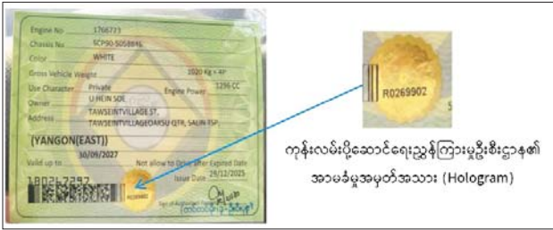
ကုန်းလမ်းပို့ဆောင်ရေးညွှန်ကြားမှုဦးစီးဌာန၏ အာမခံမှုအမှတ်အသား (Hologram)

စနစ်အားအသုံးပြုရာတွင် မော်တော်ယာဉ်၏ Wheel Tax တွင် အာမခံမှုအမှတ်အသား (Hologram) ပါရှိမှသာ အရောင်းဆိုင်ဝန်ထမ်းက Scan ဖတ်မည်ဖြစ်ပါသည်။