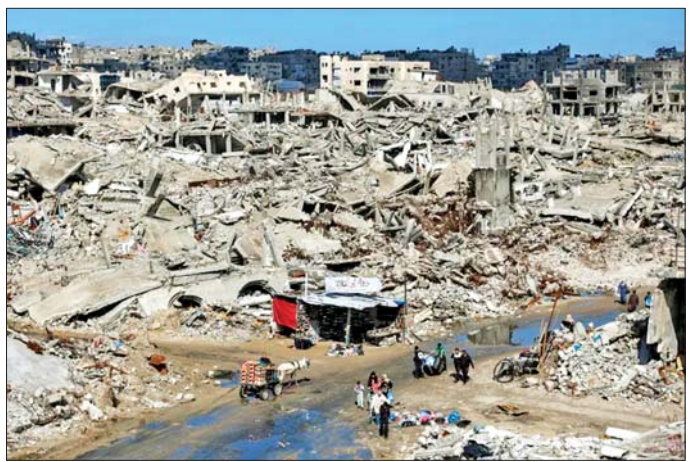
သည့်။ ကော်မတီက ဂါဇာတွင် တရားဥပဒေနှင့် လုံခြုံရေးကို ထိန်းသိမ်းရန်အတွက် အဓိကအင်အား ဖြစ်လာမည့် ပါလက်စတိုင်း လူထုရဲတပ်ဖွဲ့တွင် တာဝန်ထမ်းဆောင်ရန် လျှောက်ထားသူ ထောင်သောင်းပေါင်းများစွာကို စိစစ်ရွေးချယ်ရာတွင်လည်း

ဝါရှင်တန် မတ် ၂၆ ငြိမ်းချမ်းရေးဘုတ်အဖွဲ့ (Board of Peace) ၏ ဂါဇာဒေသဆိုင်ရာ အဆင့်မြင့်ကိုယ်စားလှယ် နှစ်ကို လေမာလာဒင်နေရာ ကုလသမဂ္ဂလုံခြုံရေးကောင်စီသို့ ဂါဇာဒေသနှင့်ပတ်သက်ပြီး ပထမဆုံးအကြိမ် အစီရင်ခံစာတစ်ရပ် တင်သွင်းခဲ့သည်။ အမေရိကန်သမ္မတ ဒေါ်နယ်ထရမ်က ဂါဇာဒေသအတွင်း အသွင်ကူးပြောင်းရေး အုပ်ချုပ်ရေးကို ကြီးကြပ်ရန် အဆိုပါ ငြိမ်းချမ်းရေးဘုတ်အဖွဲ့ကို ဖွဲ့စည်းခဲ့သည်။ ဂါဇာကမ်းခြေဒေသ စီမံခန့်ခွဲရေး အမျိုးသားကော်မတီအဖွဲ့ဝင်များက ဂါဇာဒေသသို့ လာရောက်ရန် ပြင်ဆင်နေပြီဖြစ်ကြောင်း မာလာဒင်နေရာ ပြောကြားခဲ့သည်။ ပါလက်စတိုင်းအဖွဲ့ခွဲများအကြား သဘောတူညီမှုဖြင့် အတည်ပြုထားသော ပါလက်စတိုင်းနည်းပညာရှင် ဆယ်ငါးဦးကလည်း ယခုအခါ ဂါဇာကမ်းခြေဒေသအတွက် အသွင်ကူးပြောင်းရေးကာလ အရပ်သားအာဏာပိုင်အဖွဲ့အဖြစ် ဖွဲ့စည်းလိုက်ပြီဖြစ်ကြောင်း ၎င်းက ပြောကြား