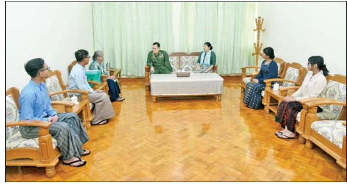
နိုင်ငံတော်လုံခြုံရေးနှင့် အေးချမ်းသာယာရေးကော်မရှင် ဒုတိယဥက္ကဋ္ဌ ဒုတိယတပ်မတော်ကာကွယ်ရေးဦးစီးချုပ် ဒုတိယဗိုလ်ချုပ်မှူးကြီး စိုးဝင်းနှင့် ဇနီး ဒေါ်သန်းသန်းနွယ် (၈၁) နှစ်မြောက် တပ်မတော်နေ့ အခမ်းအနားသို့ တက်ရောက်ကြမည့် အငြိမ်းစားတပ်မတော်အရာရှိကြီးများနှင့် ဇနီးများအား သွားရောက်တွေ့ဆုံ ဂါရဝပြုနှုတ်ဆက်စဉ်။