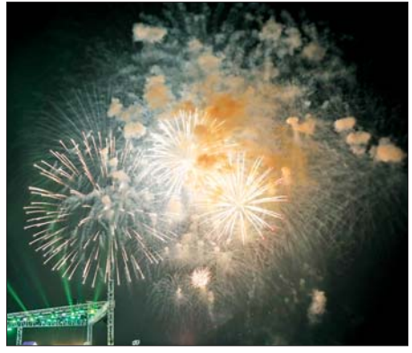
(၈၁)နှစ်မြောက် တပ်မတော်နေ့ ဂုဏ်ပြုညစာစားပွဲ အခမ်းအနား အောင်မြင်ခြင်း အထိမ်းအမှတ်အဖြစ် မီးရှူးမီးပန်းများ ပစ်ဖောက်စဉ်။

ဦးစီးချုပ်နှင့် ဇနီးတို့သည် အခမ်းအနား တက်ရောက်လာကြသူများနှင့်အတူ ဂုဏ်ပြုညစာကို အတူတကွသုံးဆောင်ကြသည်။ ညစာ မသုံးဆောင်မီနှင့် သုံးဆောင်နေစဉ်အတွင်း ကာကွယ်ရေး ဦးစီးချုပ်ရုံး(ကြည်း) ပြည်သူ့ဆက်ဆံရေးနှင့် စိတ်ဓာတ်စစ်ဆင်ရေး ညွှန်ကြားရေးမှူးရုံး ကွပ်ကဲမှုအောက် မြဝတီတေးဂီတအဖွဲ့မှ စစ်သည်၊ စစ်သမီးများ၊ မြန်မာနိုင်ငံ ရဲတပ်ဖွဲ့မှ တပ်ဖွဲ့ဝင် အဆိုရှင်များ