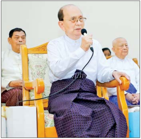
ဗိုလ်ချုပ်ကြီး သိန်းစိန် (အငြိမ်းစား) က ဩဝါဒစကားပြောကြားစဉ်။

ကျော့ဖိုးမှ ဒုတိယ ဗိုလ်ချုပ်မှူးကြီး စိုးဝင်းနှင့် ဇနီး ဒေါ်သန်းသန်းနွယ်၊ ကော်မရှင် အတွင်းရေးမှူး ကာကွယ်ရေးဦးစီးချုပ် (ကြည်း) ဗိုလ်ချုပ်ကြီး ရဲဝင်းဦးနှင့် ဇနီး၊ ကော်မရှင်အဖွဲ့ဝင် ညွှန်ကြားရေးမှူးချုပ် (ကြည်း) ဦးကျော်စွာလင်းနှင့် ဇနီး၊ ကာကွယ်ရေးဦးစီးချုပ်ရုံး (ကြည်း/ရေလေ)မှ တပ်မတော် အရာရှိကြီးများနှင့် ဇနီးများက တက်ရောက် ဂါရဝပြုကန်တော့ကြသည်။