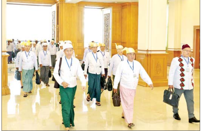
တတိယအကြိမ် အမျိုးသားလွှတ်တော် ပထမပုံမှန်အစည်းအဝေး တတိယနေ့သို့ တက်ရောက်လာကြသည့် အမျိုးသားလွှတ်တော်ကိုယ်စားလှယ်များကို တွေ့ရစဉ်။

ကော်မတီ၏တာဝန်၊ လုပ်ပိုင်ခွင့်၊ ရပိုင်ခွင့်နှင့် သက်တမ်းတို့ကို အမျိုးသားလွှတ်တော်၏အတည် ပြုချက်ရယူရာ လွှတ်တော်က သဘောတူသဖြင့် အစိုးရ၏ အာမခံချက်များ၊ ကတိများနှင့် တာဝန်ခံချက်များ စိစစ်ရေး ကော်မတီ ဖွဲ့စည်းခြင်းနှင့် ကော်မတီ၏ တာဝန်၊ လုပ်ပိုင်ခွင့်၊ ရပိုင်ခွင့်နှင့် သက်တမ်းတို့ကို အမျိုးသားလွှတ်တော်က အတည် ပြုကြောင်း ကြေညာသည်။ ကြိုတင်အသိပေး ကြေညာသွားမည် ယင်းနောက် တတိယအကြိမ် အမျိုးသားလွှတ်တော် ပထမပုံမှန် အစည်းအဝေး တတိယနေ့ကို ရပ်နားလိုက်ပြီး အစည်းအဝေး စတင်ကျင်းပမည့်နေ့ရက်နှင့် အချိန်ကို ကြိုတင်အသိပေး ကြေညာသွားမည် ဖြစ်ကြောင်း သိရသည်။ သတင်းစဉ်