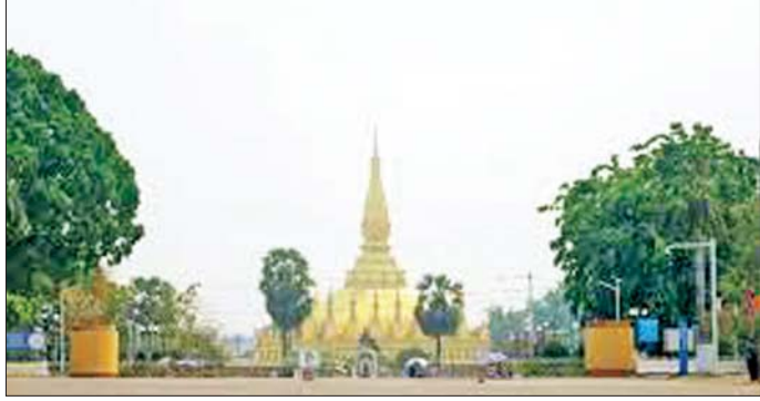
အာတာပူပိုင်းများအကြား ခိုင်မာသော ပူးပေါင်းဆောင်ရွက်မှုများ ပြုလုပ်ရန် ညွှန်ကြားထားသည်။ ကိုးကား - ဆင်ဟွာ တာဘာပြန် - စိုးသူရ

ဆာလာဗန်နှင့် အာတာပူပြည်နယ်များတွင်လည်း အမှုန်ပါဝင်မှုပမာဏ တစ်ကုဗမီတာလျှင် ၁၀၀ မိုက်ခရိုဂရမ်သို့ ကျော်လွန်၍ ကျန်းမာရေးနှင့်မညီညွတ်သော အဆင့်များသို့ ရောက်ရှိနေကြောင်း သိရသည်။ လေထုအတွင်းရှိ PM 2.5 အမှုန်သည် အဆုတ်အတွင်း စိမ့်ဝင်ကာ သွေးကြောများအတွင်းသို့ ဝင်ရောက်နိုင်ပြီး အသက်ရှူလမ်းကြောင်းနှင့် နှလုံးသွေးကြောဆိုင်ရာ ရောဂါများကို ဖြစ်စေသည်။ လေထုညစ်ညမ်းမှုက ကျန်းမာရေးဆိုင်ရာ အစီအမံများ အားကောင်းစေရန် လာအို စိုက်ပျိုးရေးနှင့် ပတ်ဝန်းကျင် ထိန်းသိမ်းရေးဝန်ကြီးဌာနက ဇန်နဝါရီ ၁၅ ရက်မှ ဧပြီလအတွင်း တောမီးများအတွက် ကြိုတင်ပြင်ဆင်မှုတစ်ရပ်ကို ထုတ်ပြန်ခဲ့