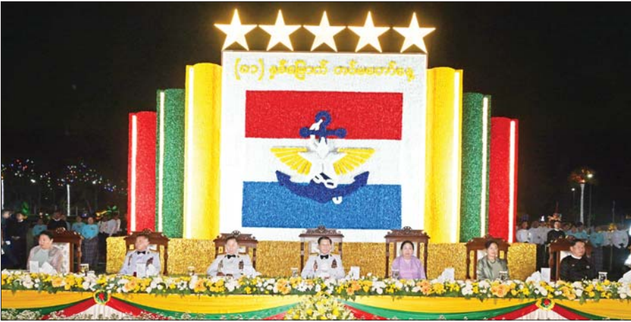
နိုင်ငံတော်လုံခြုံရေးနှင့် အေးချမ်းသာယာရေးကော်မရှင်ဥက္ကဋ္ဌ တပ်မတော်ကာကွယ်ရေးဦးစီးချုပ် ဗိုလ်ချုပ်မှူးကြီး မင်းအောင်လှိုင်နှင့် ဇနီး ဒေါ်ကြာကြာလှနှင့် အဖွဲ့ဝင်များ (၈၁)နှစ်မြောက် တပ်မတော်နေ့ ဂုဏ်ပြုညစာစားပွဲ အခမ်းအနားသို့ တက်ရောက်စဉ်။

ရေပန်းပွဲ ကော်မရှင်အဖွဲ့ဝင် ညှိနှိုင်းကွပ်ကဲရေးမှူးကြီး ချော်လဲ၊ ဗိုလ်ချုပ်ကြီး ကျော်စွာလင်းနှင့် ဇနီး၊ ကာကွယ်ရေးဦးစီးချုပ်(ရေ) ဗိုလ်ချုပ်ကြီး ထိန်ဝင်းနှင့် ဇနီး၊ ကာကွယ်ရေး ဦးစီးချုပ်(လေ) ဗိုလ်ချုပ်ကြီး ထွန်းအောင်နှင့် ဇနီး၊ ကော်မရှင် အဖွဲ့ဝင်များ၊ ပြည်ထောင်စုအဆင့်ပုဂ္ဂိုလ်များနှင့် ဇနီးများ၊ ကာကွယ်ရေးဦးစီးချုပ်ရုံးမှ အဆင့်မြင့် တပ်မတော်အရာရှိကြီးများနှင့် ဇနီးများ၊ ရဲဘော်သုံးကျိပ်ဝင် မိသားစုဝင်များ၊ အငြိမ်းစား တပ်မတော်ကာကွယ်ရေးဦးစီးချုပ်များ၏မိသားစုဝင်များ၊ အငြိမ်းစားတပ်မတော်(ကြည်း)၊ ရေလေ)အရာရှိကြီးများ၊ လွတ်လပ်ရေးမော်ကွန်းဝင် ပုဂ္ဂိုလ်ကြီးများ၊ အကြံပေးပုဂ္ဂိုလ်များ၊ ဒုတိယဝန်ကြီးများ၊ တပ်မတော်သားအငြိမ်းစား သံအမတ်ကြီးများ၊ နိုင်ငံခြားစစ်သံရုံးများမှ စစ်သံမှူးများနှင့် တာဝန်ရှိသူများ၊ တစ်နိုင်လုံးပစ်ခတ်တိုက်ခိုက်မှု ရပ်စဲရေးသဘောတူစာချုပ်(NCA) လက်မှတ်ရေးထိုးထားသည့် တိုင်းရင်းသားလက်နက်ကိုင် အဖွဲ့များမှ ကိုယ်စားလှယ်များ၊ နိုင်ငံရေးပါတီများမှ ဥက္ကဋ္ဌများနှင့် တာဝန်ရှိသူများ၊ အောင်ဆန်းသူရိယသွဲ့ရရှိခဲ့သူများ၏ မိသားစုဝင်များနှင့်