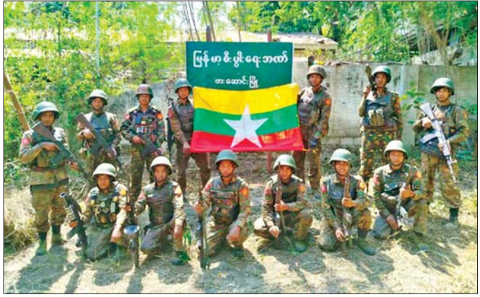
အကြမ်းဖက်သောင်းကျန်းသူများ ယာယီစိုးမိုးထားသည့် ဖားဆောင်းမြို့အား ၁၅-၂၀၂၆ ရက်နေ့တွင် တပ်မတော်စစ်ကြောင်းများက ပြန်လည်တိုက်ခိုက်သိမ်းပိုက်ရရှိစဉ်။